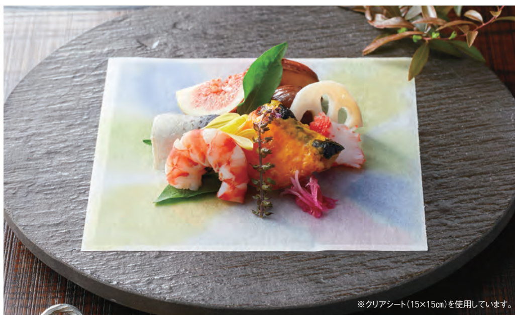
※クリアシート(15×15cm)を使用しています。

ご使用上の注意 食用色素インキを使用しておりませんので、直接お料理を盛りつける時は、必ず印刷部分避けるかOPクリアシートをご使用ください。